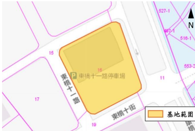
圖 2 基地地籍圖