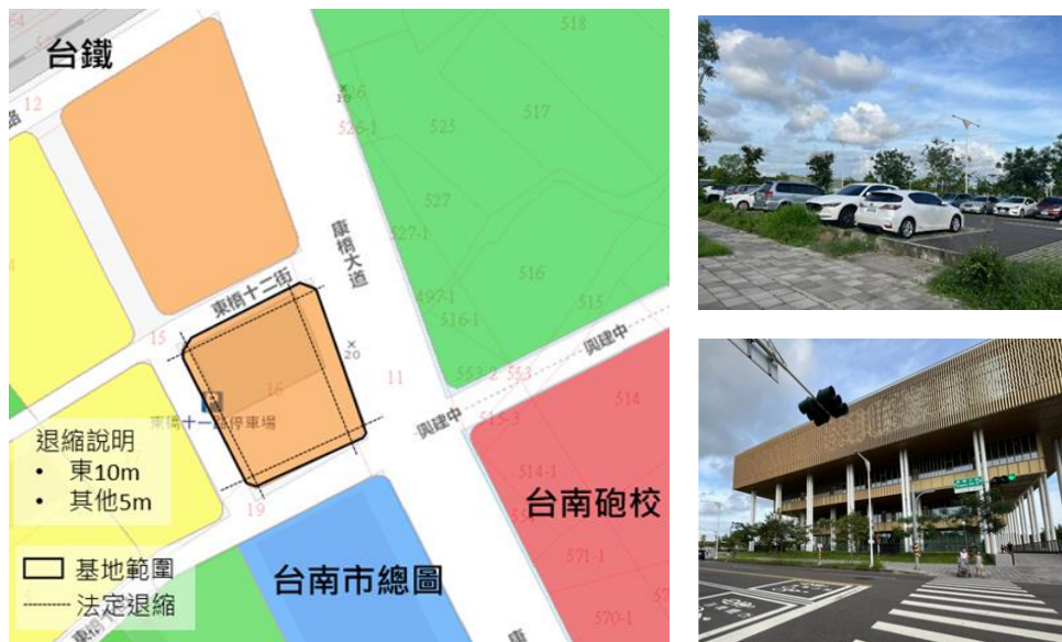
圖 1 本案基地區位示意圖

基地位於臺南市永康區東橋里，範圍以康橋大道、東橋十二街、東橋十一路、東橋十街所圍之街廓，全區位為創意設計園區計畫開發案之範圍，鄰近臺南市立圖書館總館。基地鄰近臺南市立圖書館總館，周邊鄰近東橋重劃區，其住宅型態多為高樓層住宅大樓，而現況為平面停車場使用。