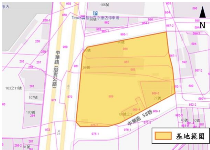
圖 2 基地地籍圖