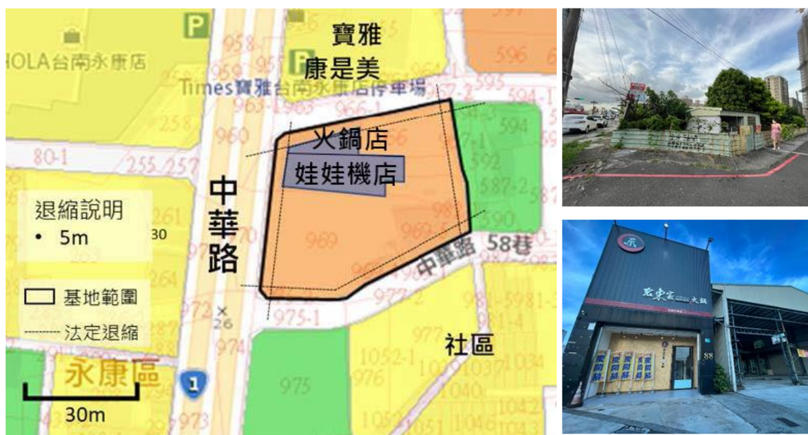
圖 1 本案基地區位示意圖

基地位於臺南市永康區成功里，範圍以中華路、中華路 134 巷 5 弄、中華路 92 巷及中華路 58 巷所圍之街廓，鄰近平實營區重劃區、平實公園、中華路商圈、兵仔市及南紡購物中心，未來本基地亦位於捷運系統 B13、B14 間，而現況存有零星地上建物、果園，由國有財產署以三七五減租出租予民眾使用。