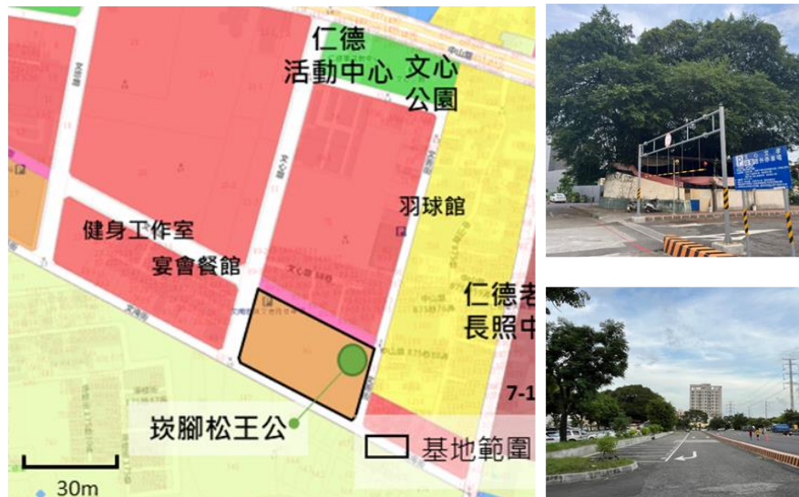
圖 1 本案基地區位示意圖

基地位於臺南市仁德區仁德里，範圍以文心路、文孝路、文善街及文南街所圍塑之街廓，周邊多為商業區，鄰近衛生福利部胸腔病院及仁德綜合轉運站，現況為平面停車場使用。